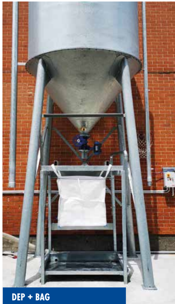
DEP + BAG